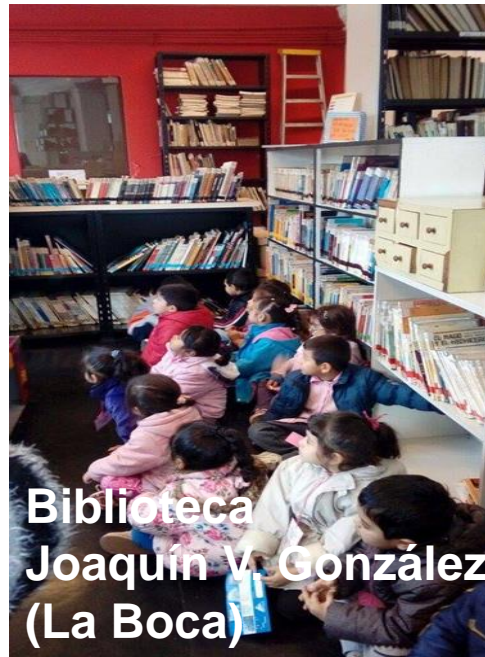
Biblioteca Joaquín V. González (La Boca)