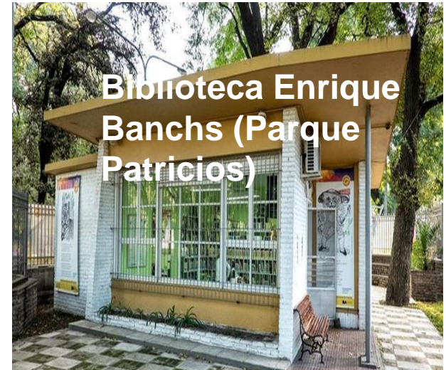
Biblioteca Enrique Banchs (Parque Patricios)