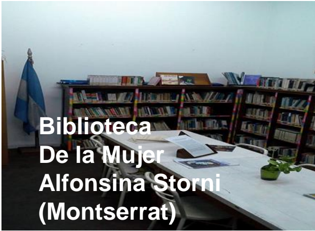
Biblioteca De la Mujer Alfonsina Storni (Montserrat)