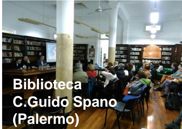
Biblioteca C. Guido Spano (Palermo)