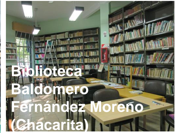
Biblioteca Baldomero Fernández Moreño (Chacarita)