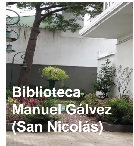
Biblioteca Manuel Gálvez (San Nicolás)