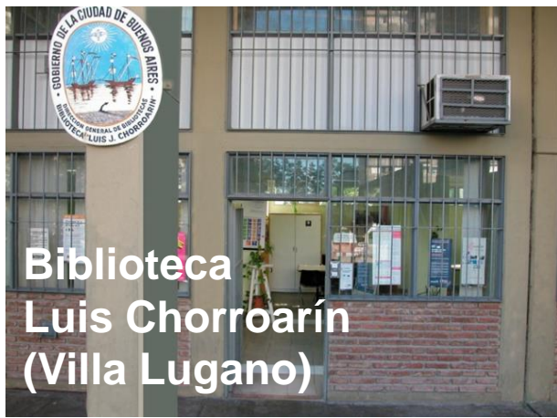
Biblioteca Luis Chorroarín (Villa Lugano)