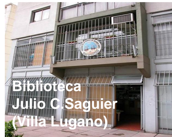
Biblioteca Julio C.Saguier (Villa Lugano)