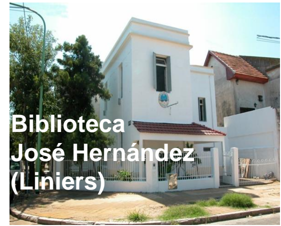
Biblioteca José Hernández (Liniers)