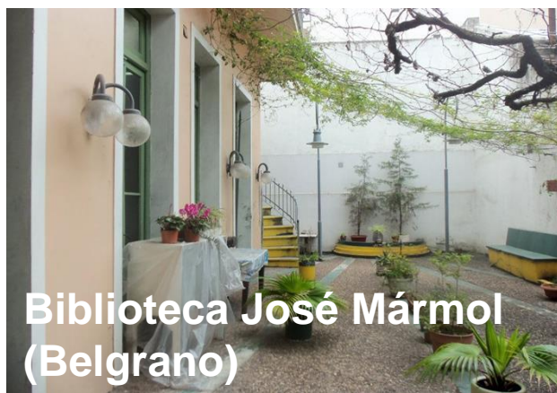
Biblioteca José Mármol (Belgrano)