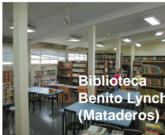
Biblioteca Benito Lynch (Mataderos)