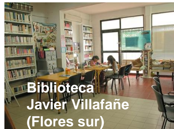
Biblioteca Javier Villafañe (Flores sur)