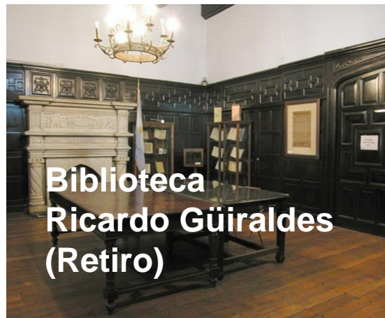
Biblioteca Ricardo Güiraldes (Retiro)