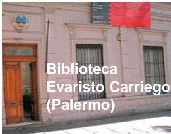
Biblioteca Evaristo Carriego (Palermo)