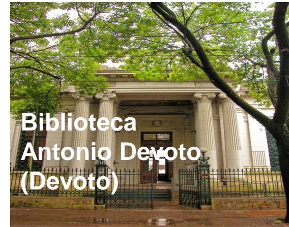
Biblioteca Antonio Devoto (Devoto)