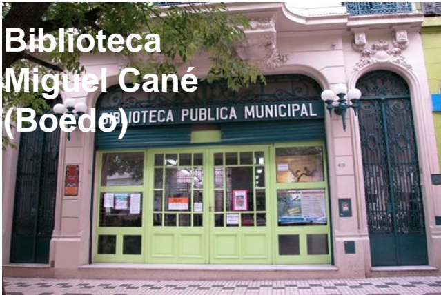
Biblioteca Miguel Cané (Boedo)