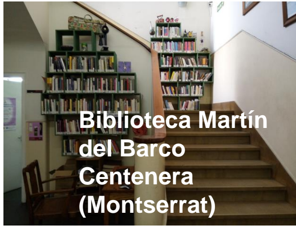
Biblioteca Martín del Barco Centenera (Montserrat)