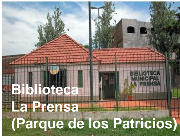
Biblioteca La Prensa (Parque de los Patricios)