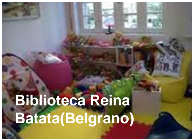
Biblioteca Reina Batata(Belgrano)