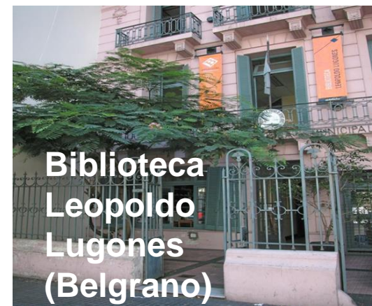
Biblioteca Leopoldo Lugones (Belgrano)