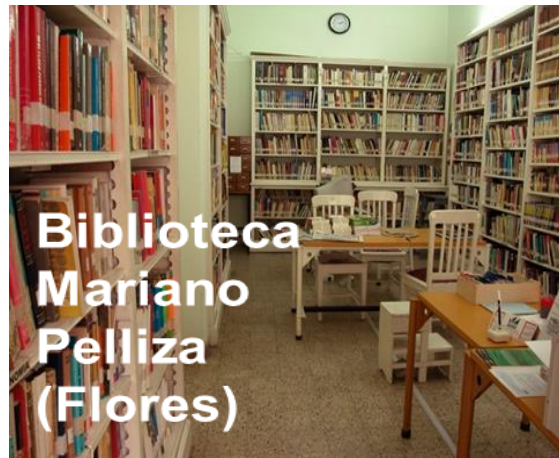
Biblioteca Mariano Pelliza (Flores)