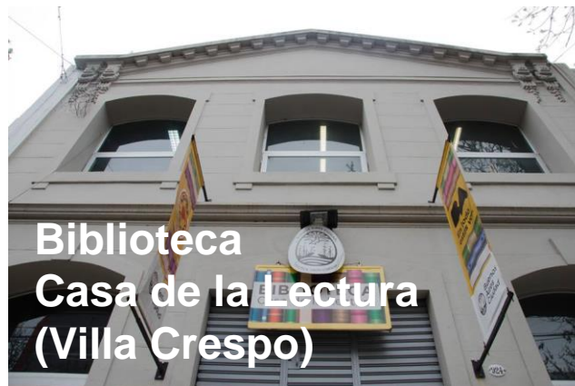
Biblioteca Casa de la Lectura (Villa Crespo)