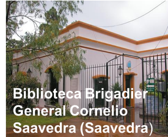
Biblioteca Brigadier General Cornelio Saavedra (Saavedra)